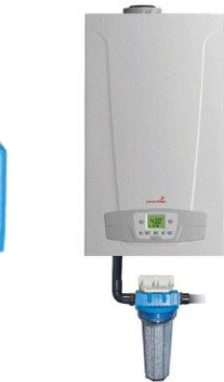
NE 40 Référence 72500