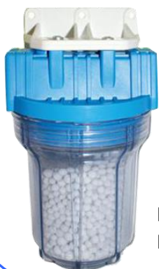
NE 23 Référence 72400